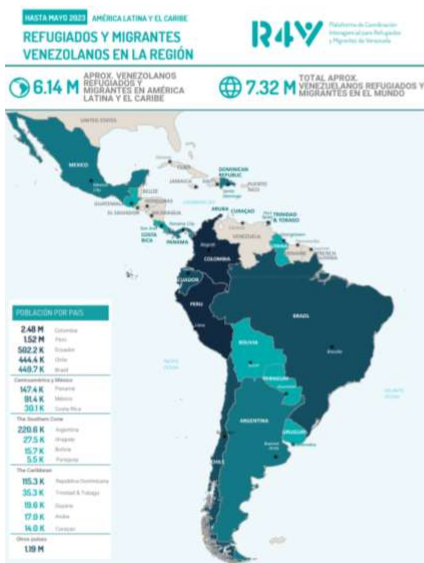
Figura 1. Mapa de flujos de refugiados y migrantes venezolanos en América, 2023.

destinos serían: Colombia, Perú, Brasil, Ecuador, Chile, Argentina, República Dominicana, México, Panamá y Trinidad y Tobago, en conjunto acogen al 98% de personas en contexto de movilidad humana en la región Latinoamericana, tal como se muestra en la ilustración a continuación. 143 Ver anexo 5.