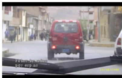
Figura 9. Registros de los espías en seguimiento a Marco Arana. Still Frame de Operación Diablo (2010)

La escena 13 es clave porque muestra la apropiación de estos materiales por parte del documental para su resignificación. Se presentan grabaciones, documentos, fotografías y registros de seguimiento del Padre Marco Arana y otros activistas, convirtiendo el archivo en una evidencia directa de la persecución sistemática contra defensores del medio ambiente (ver Figura 9 Y 10). Durante la escena, se ven las instalaciones, computadoras, discos duros, fotografías, videos e informes detallados sobre la actividad del Padre Marco Arana y los activistas de GRUFIDES. Se pone en evidencia en el montaje la apropiación de estos contenidos para resignificarlos en favor de la denuncia contra las estrategias de persecución y criminalización de la empresa minera. Sin embargo, no se queda en el desmontaje de esta red de espionaje en Cajamarca, sino que logra crear conexiones con otros casos que parecieran aislados, pero que responden a una estrategia heredada de la época de la violencia política en Perú.