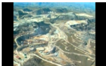
Figura 2. Mapa del tajo abierto de la minera Yanacocha. Still Frame de Choropampa, el precio del oro (2002)

Esta construcción de la mirada también se vincula con las prácticas de autorreflexividad del documental contemporáneo, donde los realizadores reconocen sus propias posiciones de poder y cuestionan las relaciones entre el observador y lo observado.