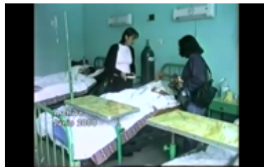
Figura 3. Activistas visitan a pobladores intoxicados. Still Frame de Choropampa, el precio del oro (2002)

La película también recurre a otros archivos institucionales para interpelar a los responsables, de esta manera introducen un informe del Banco Mundial, que inicialmente se presenta como fuente neutral, pero que es desmontado a través de una voz en off que expone su participación accionaria en Yanacocha. Así, el archivo es empleado no solo como documento ilustrativo, sino como elemento clave para cuestionar discursos de supuesta imparcialidad. La secuencia da cuenta de cómo uno de los médicos responsables tenía vínculos con la empresa minera, y manipuló la información lo cual tuvo consecuencias directas en la salud de las personas. Mientras ocurre esta interpelación se suman archivos nuevamente de junio del 2000 (ver Figura 3), ahora de personas de la comunidad internados en el hospital regional de Cajamarca a consecuencia de la intoxicación por la contaminación por mercurio.