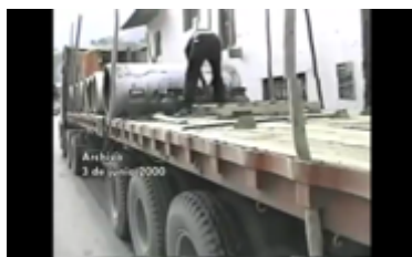
Figura 1. La Comunidad recoge residuos de mercurio. Still Frame de Choropampa, el precio del oro (2002)

En este primer bloque, el uso del archivo también incluye fotografías tomadas en junio de 2000, reforzando visualmente la narrativa testimonial. A medida que los testimonios se desarrollan, el material de archivo ya no solo sirve para contextualizar los eventos, sino que enfatiza el impacto humano y ambiental del derrame. La propuesta narrativa y de uso de archivos se va a repetir en una constante a lo largo de toda la película, dando al archivo un más de ilustración y testimonio que de exploración o resignificación estética y/o poética.