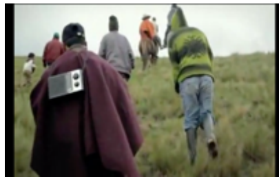
Figura 16. Ronderos y ronderas caminan para acampar en la laguna Azul. Still Frame de Hija de la Laguna (2015)

En contraposición a la mirada mercantil sobre la naturaleza, en regiones como Cajamarca persiste una cosmovisión andina que considera la tierra y el agua como seres vivos y sagrados. El agua, símbolo fundamental de vida, se convierte en eje de disputa territorial; expresiones como “agua sí, oro no” o el reconocimiento de las lagunas como espacios sagrados refuerzan la idea de que no se trata simplemente de insumos económicos, sino de elementos esenciales para la sostenibilidad de la vida humana y no humana. Esta resignificación del agua plantea un desafío político y cultural al discurso extractivista centrado exclusivamente en la rentabilidad.