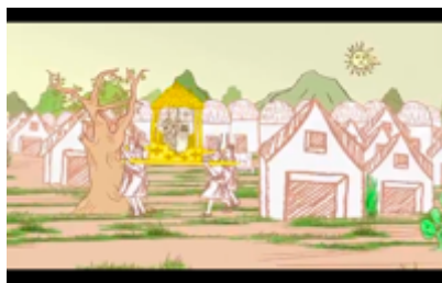
Figura 7. Animación sobre la maldición de la abundancia en Cajamarca. Still Frame de Operación Diablo (2010)

Uno de los momentos más significativos del documental ocurre en las escenas 9 y 10, luego del triunfo de las comunidades para detener la explotación del Cerro Quilish, se desarrolla la trama de cuando los activistas descubren la red de espionaje de FORZA. Esto haciendo uso de materiales de archivo periodísticos de diarios y revistas (ver Figura 8). En estas secuencias, el documental hace un uso inusual del archivo, combinando material registrado tanto por los espías como por los espiados. Esta inversión en el uso del archivo resignifica las imágenes, exponiendo el control y la vigilancia como estrategias de intimidación.