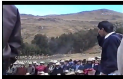
Figura 6. Asamblea en medio de protesta y bloqueo de carreteras. Still Frame de Operación Diablo (2010)

queda solo en manos de las comunidades campesinas, sino que la ciudad de Cajamarca se pliega a la lucha y los enfrentamientos llegan hasta la plaza principal.