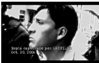
Figura 10. Momento de la detención del primer espía. Still Frame de Operación Diablo (2010)

En la escena 16, el documental amplía su enfoque al vincular la “Operación Diablo” con otros casos de represión y criminalización de la protesta en Perú. A través del archivo, se introduce el “Caso Majaz”, que documenta el secuestro y tortura de activistas y periodistas opositores a la minera Majaz. Estos materiales permiten conectar la operación de FORZA con una red más amplia de violencia estructural, heredada de las estrategias contrainsurgentes de la década de 1990.