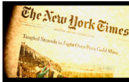
Figura 8. Notas periodísticas sobre el triunfo contra la empresa minera. Still Frame de Operación Diablo (2010)

La escena 13 es clave porque muestra la apropiación de estos materiales por parte del documental para su resignificación. Se presentan grabaciones, documentos, fotografías y registros de seguimiento del Padre Marco Arana y otros activistas, convirtiendo el archivo en una evidencia directa de la persecución sistemática contra defensores del medio ambiente (ver Figura 9 Y 10). Durante la escena, se ven las instalaciones, computadoras, discos duros, fotografías, videos e informes detallados sobre la actividad del Padre Marco Arana y los activistas de GRUFIDES. Se pone en evidencia en el montaje la apropiación de estos contenidos para resignificarlos en favor de la denuncia contra las estrategias de persecución y criminalización de la empresa minera. Sin embargo, no se queda en el desmontaje de esta red de espionaje en Cajamarca, sino que logra crear conexiones con otros casos que parecieran aislados, pero que responden a una estrategia heredada de la época de la violencia política en Perú.