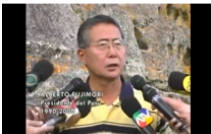
Figura 4. Prensa nacional entrevistan al dictador Fujimori. Still Frame de Choropampa, el precio del oro (2002)

Para el momento de la tercera escena que ilustra lo que ha pasado seis meses después en la comunidad, la trama incorpora material de archivo periodístico para mostrar la gestión del caso en la esfera gubernamental, la escena presenta imágenes de Alberto Fujimori respondiendo a la prensa sobre el derrame, situando la problemática en un contexto político más amplio que más adelante en la película de desarrolla. En este punto, la estrategia documental alterna entre registros periodísticos (ver Figura 4) y material grabado por el propio equipo de Guarango, incluyendo entrevistas con la comisión de salud enviada por el gobierno. Esta combinación de archivos refuerza la idea de que la narrativa oficial quita importancia al desastre, mientras que los testimonios de la gente revelan las consecuencias en la salud. Con ello se da peso a las voces históricamente silenciadas u omitidas por los grandes medios, así los gestos testimoniales de las y los pobladores toman protagonismo a lo largo del largometraje.