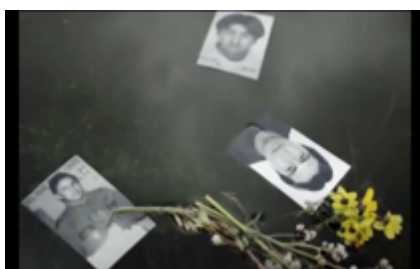
Figura 14. Nélidea ofrenda a la laguna fotografías de los mártires del agua. Still Frame de Hija de la Laguna (2015)

Este uso del archivo visual se intensifica en la escena 12, cuando la película recurre a la fotografía como un elemento de ofrenda a los muertos de la represión estatal en Celendín y Bambamarca (2012). Las imágenes de los rostros de los fallecidos flotando en la laguna (ver Figura 14) resignifican el archivo en un gesto simbólico y ritual, alejándose del registro periodístico y acercándose a una dimensión espiritual y de duelo colectivo.