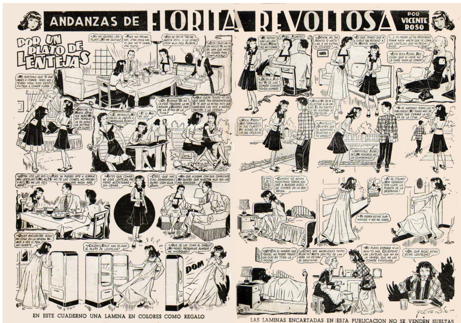
Ilustración 2. Páginas interiores de Florita

Un ejemplo de tebeo femenino publicado por Cliper, una editorial sin vínculos directos con el régimen. La comicidad de la historia parte del hecho de que Florita se muestra caprichosa con la comida, ante lo cual el padre actúa con su autoridad de cabeza de familia, prohibiendo a su hija comer otra cosa hasta que despache el plato de lentejas que ha dejado; tras varias peripecias, la muchacha se come las lentejas encantada, mostrándose de ese modo la sabiduría del patriarca; mediante el humor, la publicación reforzaba los valores tradicionales de autoridad y jerarquía. Páginas interiores de Florita n.º 2 (1949), editorial Cliper.