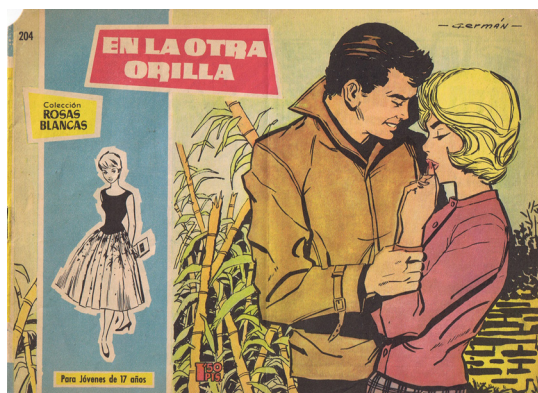
Ilustración 3. Portada de Rosas Blancas

El amor se convirtió en un elemento común de los tebeos femeninos, mostrándose en sus páginas cuáles eran las conductas adecuadas para tener éxito en una relación, siempre desde un punto de vista idealizado y, por supuesto, totalmente asexuado que presentaba el amor como un sentimiento que nada tenía que ver con la pasión física. Portada de Rosas Blancas n.º 198 (1958), editorial Toray.