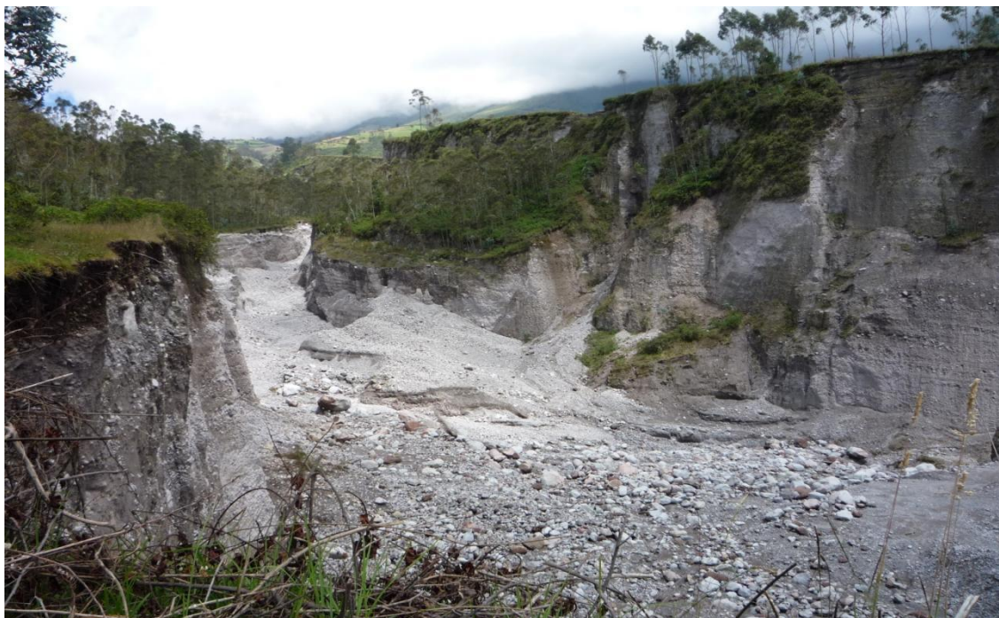
Figura 2 Laderas de la comunidad de San Cristóbal, taludes originados en el territorio del pueblo kichwa karanki foto de octubre del 2023.

La explotación vertical de la cantera hizo que los terrenos cercanos a la quebrada se erosionen, y existan derrumbos permanentes por la humedad.