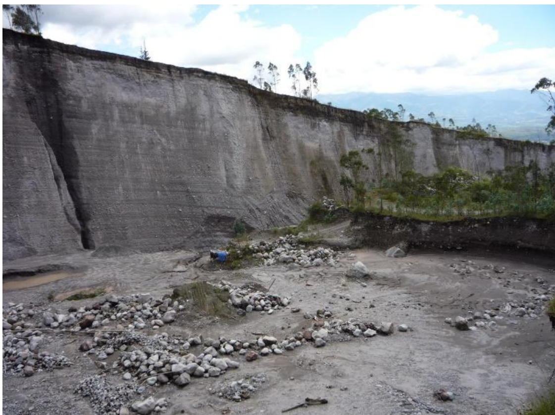
Figura 1. Cantera “El Rey”, cantera ubicada en suelo del pueblo kichwa karanki foto de octubre del 2023

En el año 2011 las comunidades de San Clemente, San Cristóbal Alto, Manzanal y Naranjito fueron afectadas por la contaminación ambiental que generaban dos Canteras de arena llamadas “Canteras El Rey” y “Canteras San Luis”, que desde hace algunos años venían explotando material pétreo y arena al interior de las comunidades referidas, provocando una gran cantidad de polvo a varios kilómetros a la redonda del lugar de explotación, grandes agujeros y ruido que afectaba la paz en la comunidad.